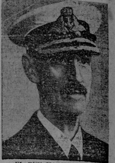
EL REY HAAGON VII DE NORUEGA. Quien celebró su octogésimo cumpleaños el 3 de agosto próximo pasado.