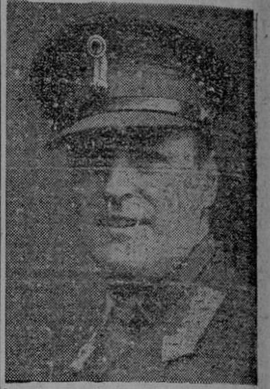
Olaf, Principe de la Corona Noruega. Quien cumplió medio siglo de vida el 2 de Julio último